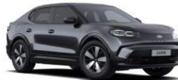
MAGNETIC GREY - lakier metalizowany 3 000 zł Lakier niedostępny dla wersji Collection