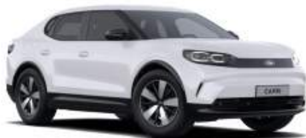
FROZEN WHITE - lakier zwykły 1 500 zł Lakier niedostępny dla wersji Collection