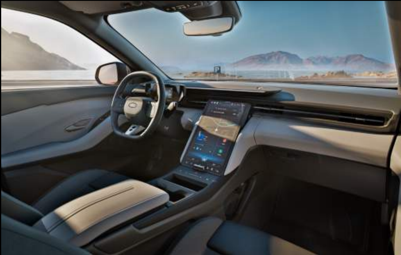
Ford Capri® w wersji Premium z opcjonalnym wyposażeniem

Centralnym punktem kabiny jest dotykowy wyświetlacz 14,6" z systemem SYNC Move — z bezprzewodowym Android Auto™ i Apple CarPlay™ zawsze pod ręką. Asystent parkowania zyskał funkcję Memory, która zapamiętuje i automatyzuje powtarzalne manewry - wjazd do garażu nigdy nie był prostszy. Nowością jest także One Pedal Driving - system, który pozwala prowadzić praktycznie bez dotykania hamulca. Odpuszczenie pedału gazu uruchamia rekuperację, która odzyskuje energię i zwalnia pojazd płynnie i bezwysiłkowo. Stworzone z myślą o codziennych podróżach po mieście..