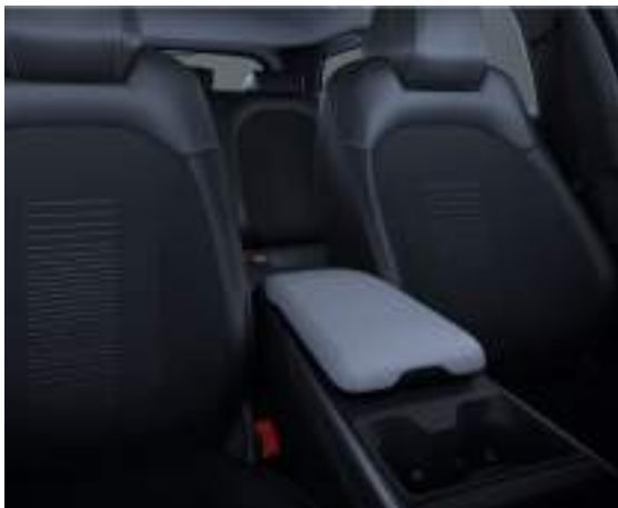
Tapicerka dostępna w pakiecie Comfort AGR Wyposażenie opcjonalne dla wersji Capri i Premium