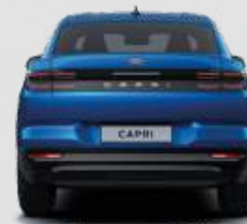
Wysokość całkowita 1627 mm