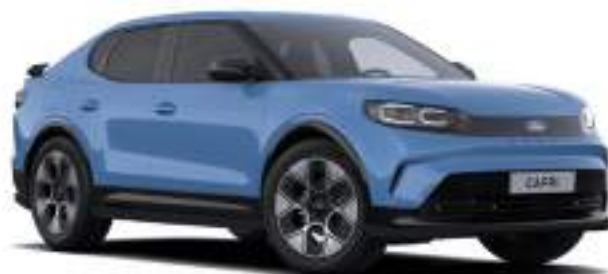
TRIBUTE BLUE - lakier metalizowany specjalny bez dopłaty Lakier dostępny tylko dla wersji Collection