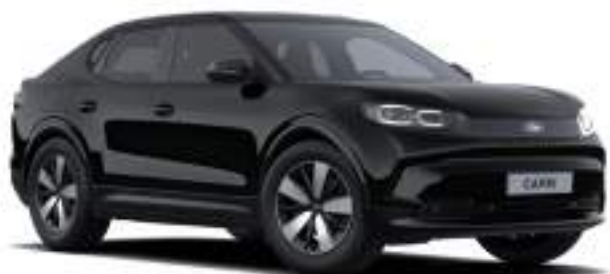
AGATE BLACK - lakier metalizowany 3 000 zł Lakier niedostępny dla wersji Collection