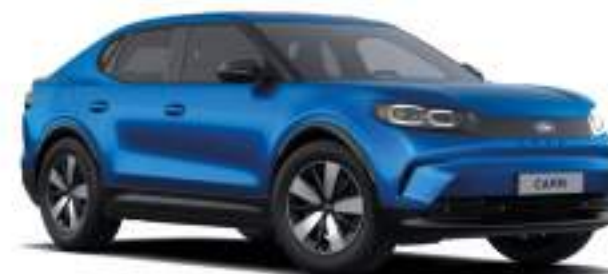
BLUE MY MIND - lakier metalizowany specjalny 4 500 zł Lakier niedostępny dla wersji Collection