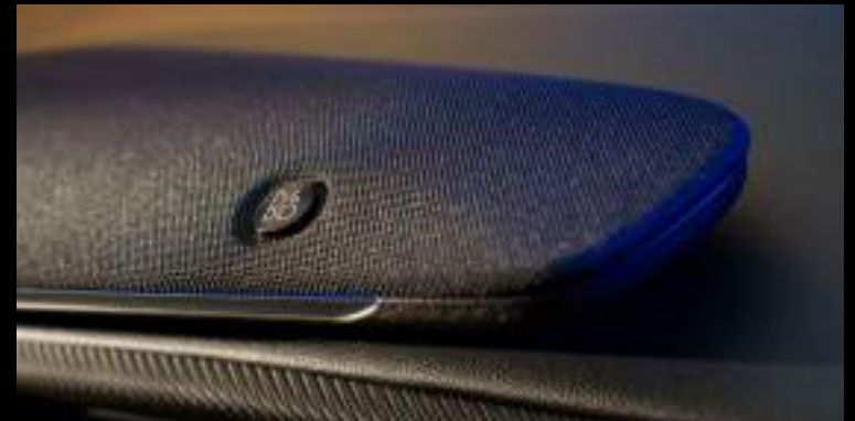
System nagłośnienia Premium B&O

Wyposażenie opcjonalne dla wszystkich wersji