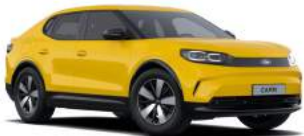
VIVID YELLOW - lakier zwykły bez dopłaty Lakier niedostępny dla wersji Collection