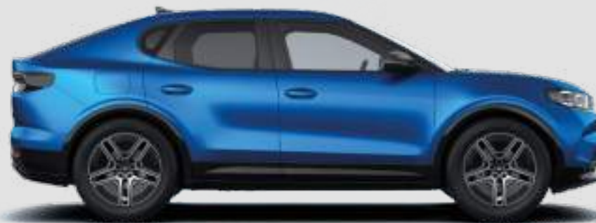
Długość całkowita 4634 mm (4690 mm dla wersji Collection)

Pomiar zgodnie z normą ISO 3832. Rzeczywiste wymiary mogą się różnić od podanych wartości w zależności od wersji i wyposażenia. Wszystkie podane wyżej wartości są danymi fabrycznymi.