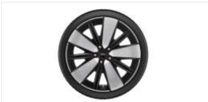
19" koła zimowe z czujnikami ciśnienia

Opony Nokian Snowproof 2 SUV, 235/55 R19 105 V XL (2 712 263)