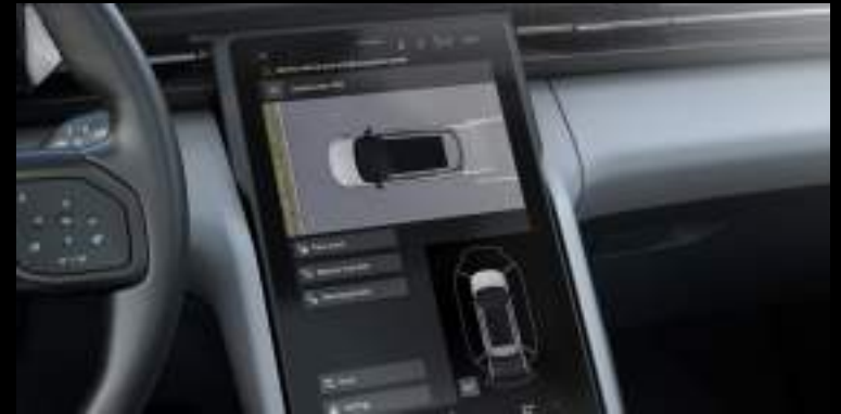
Asystent parkowania z funkcją Memory

Wyposażenie opcjonalne dla wszystkich wersji