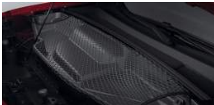
Organizer do bagażnika przedniego (2 825 614)