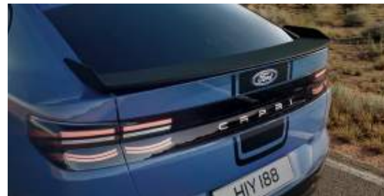
Charakterystyczne oklejenie oraz tylny spoiler Wyposażenie standardowe wersji Collection