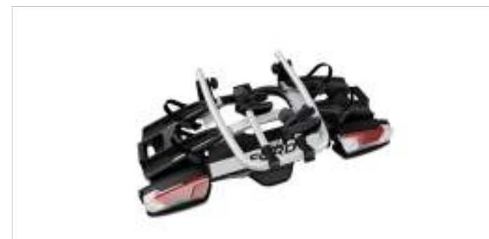
Thule®* Mocowany z tyłu pojazdu bagażnik rowerowy (2 353 442)