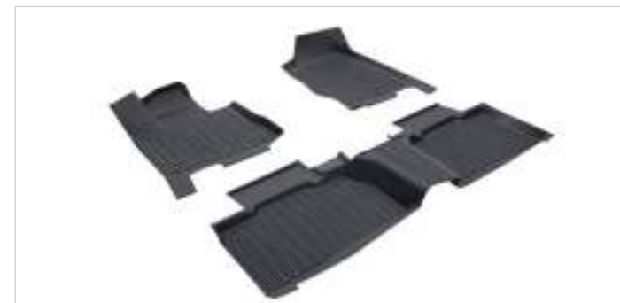
Dywaniki podłogowe, gumowe przednie i tylne (2 328 965)