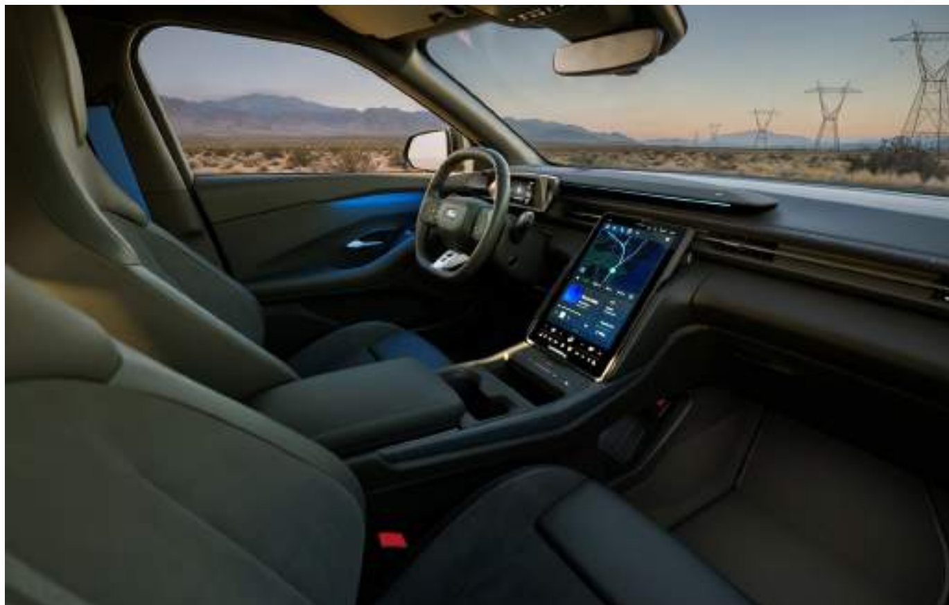
Ford Capri® w wersji Collection