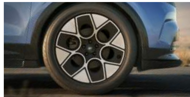
21"obrócze kół ze stopów lekkich Wyposażenie standardowe wersji Collection