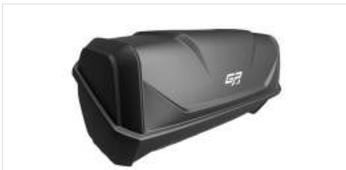
Bagażnik mocowania na haku holowniczym (2 831 824)